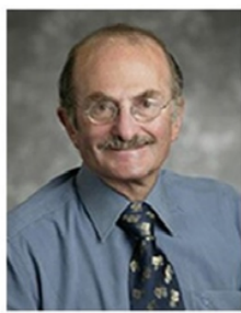
Charles Cantor 美国科学院院士