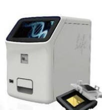
QuantStudio™ 3D Digital PCR