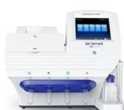
Ion PGM™ 高通量基因测序仪