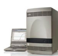
Applied Biosystems® 7500 Fast Real-Time PCR