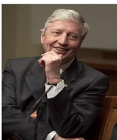
Jules A Hoffman 诺奖得主